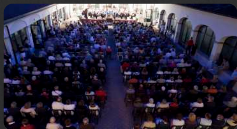
edizione del 2010