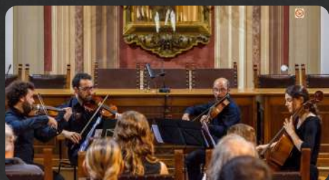
edizione del 2013