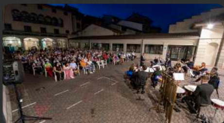
edizione del 2021