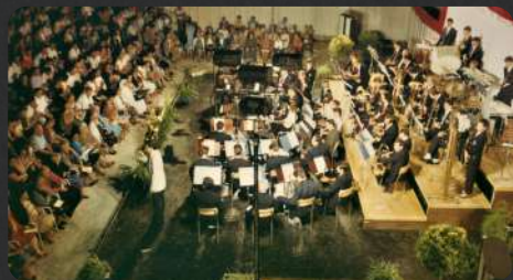
edizione del 1986