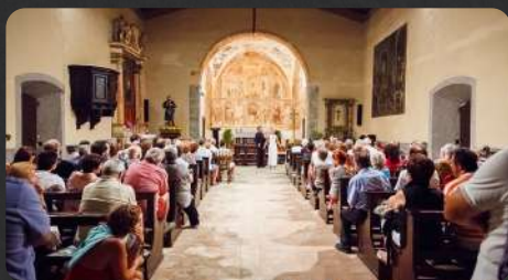
edizione del 2012