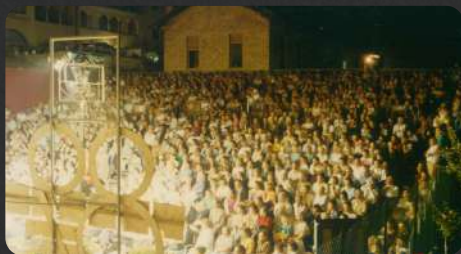
edizione del 1989